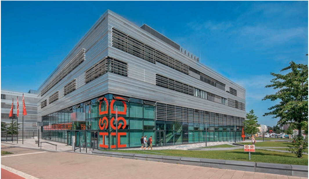
Die Schülerlaborkurse finden in den Räumlichkeiten des ZIES auf dem Campus der Hochschule Düsseldorf statt.