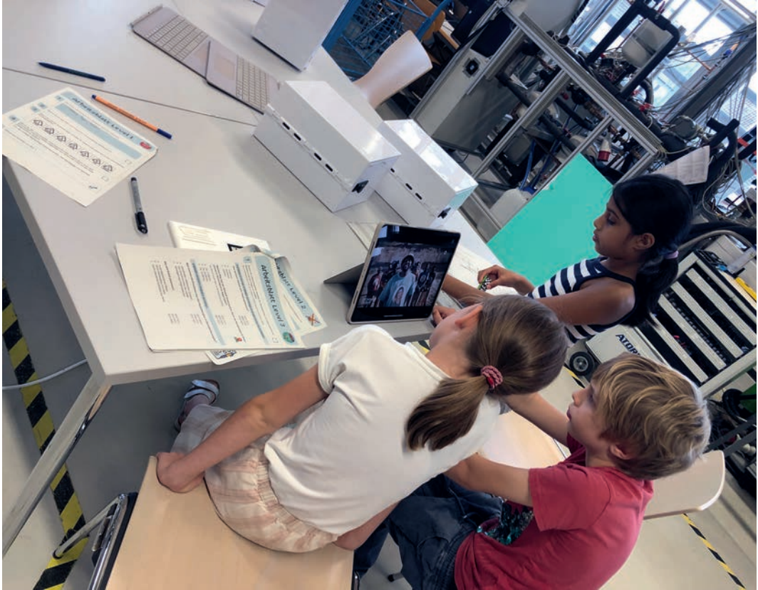
Bild 4: Das Feedback aus der praktischen Anwendung der entwickelten Experimente ist sowohl seitens der Schüler:innen als auch Lehrenden durchweg sehr positiv.